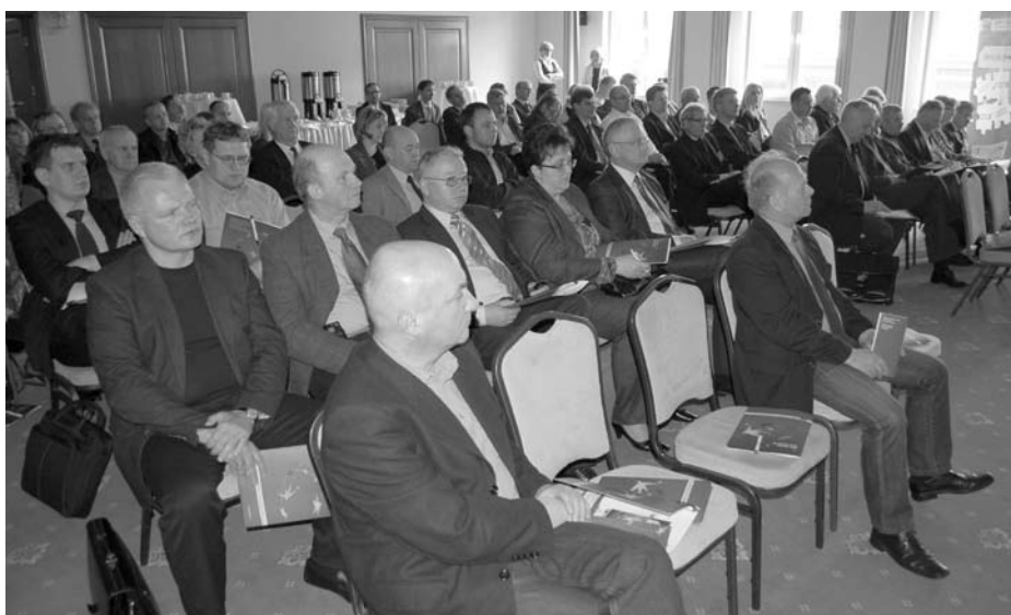
Tematyka spotkania była interesująca dla przedsiębiorców

Staropolska Izba Przemysłowo-Handlowa współgospodarzem konferencji pt. „Jak zdobyć nawet 150 tysięcy euro dofinansowania na jeden projekt?”