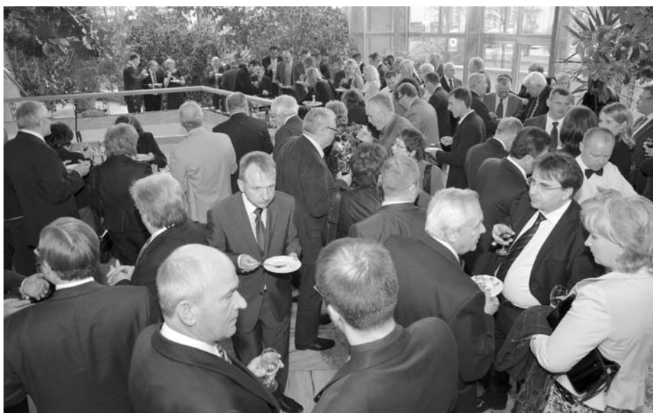
Spotkanie towarzyskie w foyer Kieleckiego Centrum Kultury

24 maja Telewizja Kielce wyemitowała „Panoramę gospodarczą” w całości poświęconą konkursowi NOVATOR 2011.