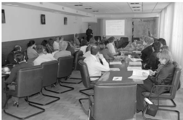
Uczestnicy seminarium w ośrodku AFOR w Borkowie