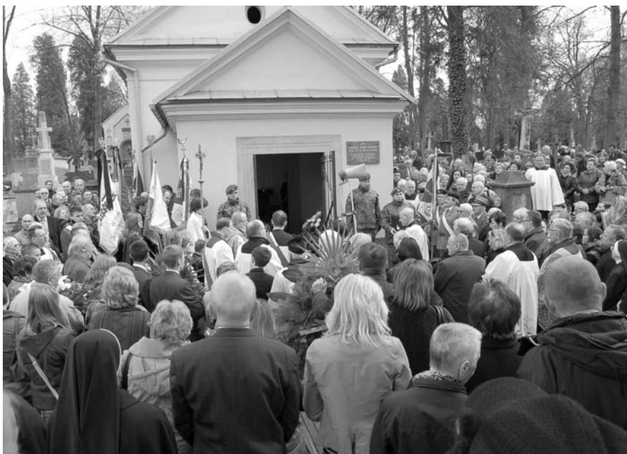
Uroczystości pogrzebowe na Cmentarzu Starym w Kielcach